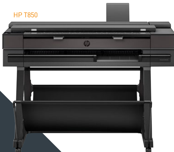
Imprimer en bobine au format