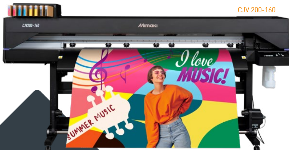
Technologie éco-solvant, print & cut