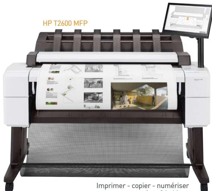
Imprimer - copier - numériser en 1 ou 2 bobines

Gamme HP encres aqueuse pour couvrir toutes les applications