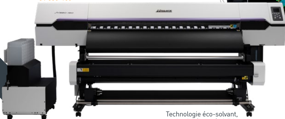
Technologie éco-solvant, productivité et coût faible