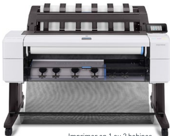
Imprimer en 1 ou 2 bobines