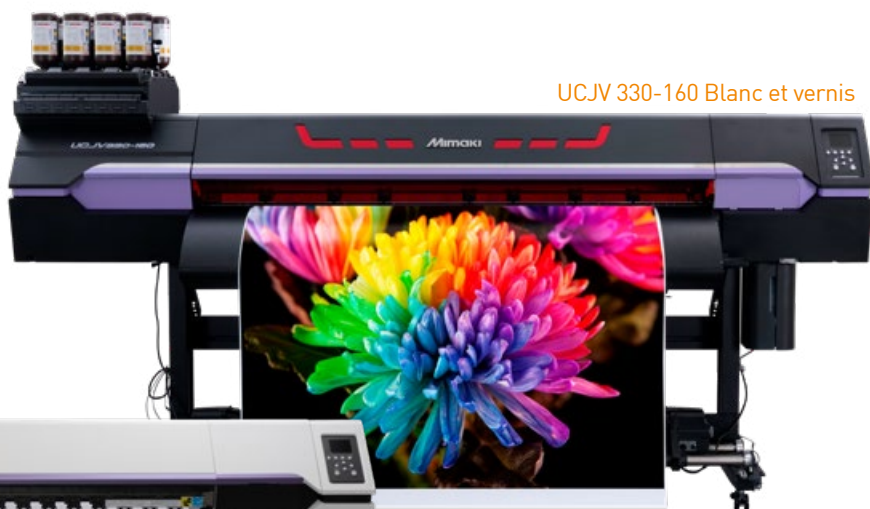
Technologie UV, qualité et finesse exceptionnelle